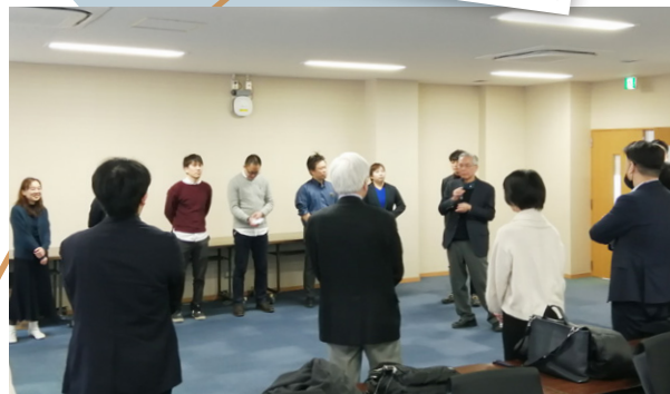
前回（2024年3月）開催の様子